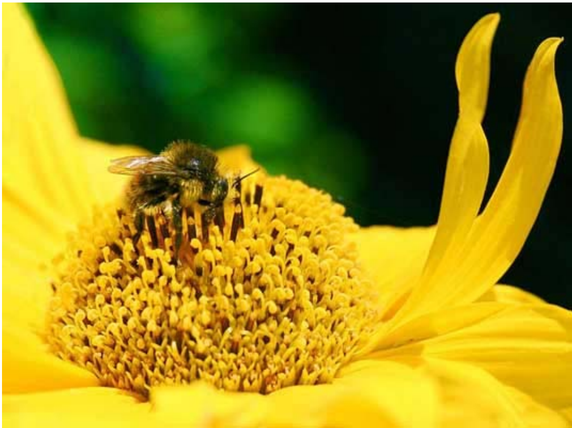
Virágport gyűjtő méh

A méh- és darázméreg allergia tünetei lehetnek enyhe, helyi panaszok, de súlyos, életveszélyes állapot is kialakulhat. Az enyhébb panaszok közül különös figyelmet igényel, ha a csípés helyén több napon át tartó, vörös, viszkető, 12 centiméternél is nagyobb átmérőjű duzzanat keletkezik.